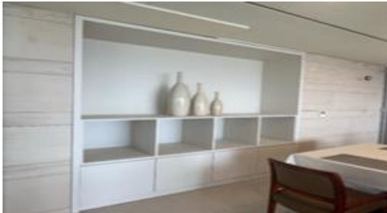
[PDR룸 보스턴백 보관함 조성]