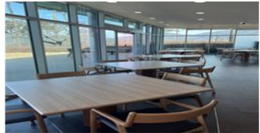
[테이블 및 의자 교체]