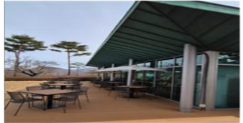
[테라스 어닝 설치]