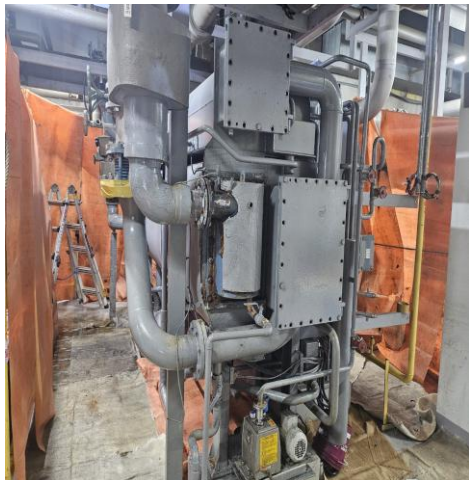
[기존 설치 장비]