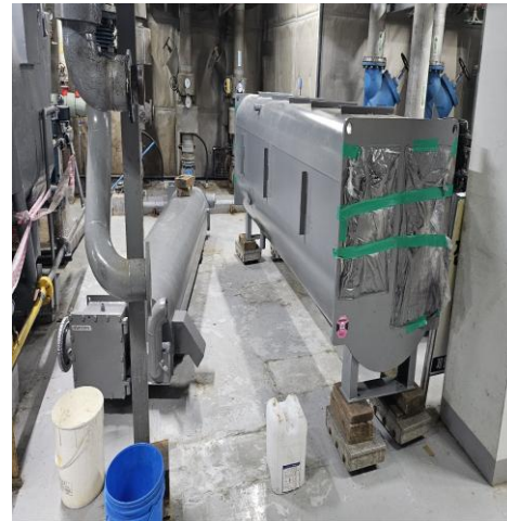
[신규 장비 입고]