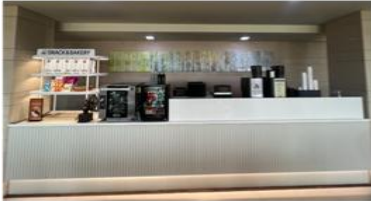
[베이커리 및 스낵바 조성]