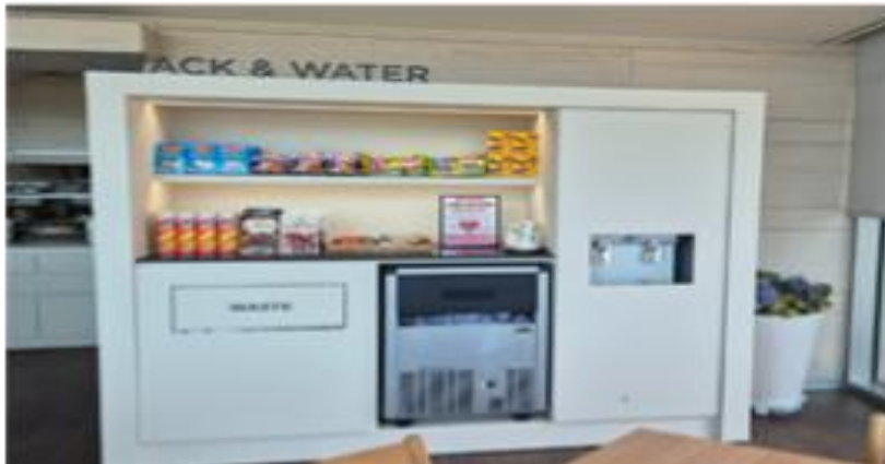
[스낵바 및 제빙기 설치]