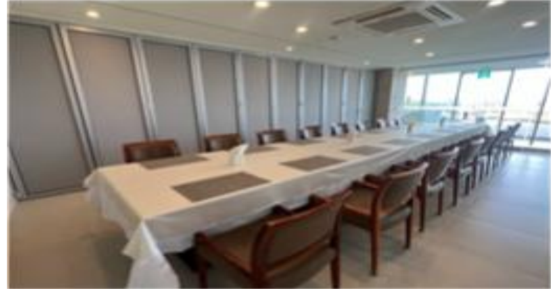
[PDR룸 폴딩 도어 신규 설치]