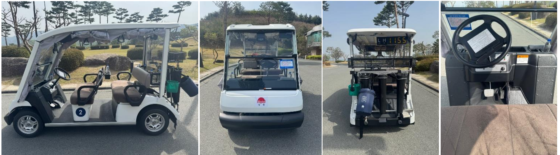
[야마하 5인승 카트]