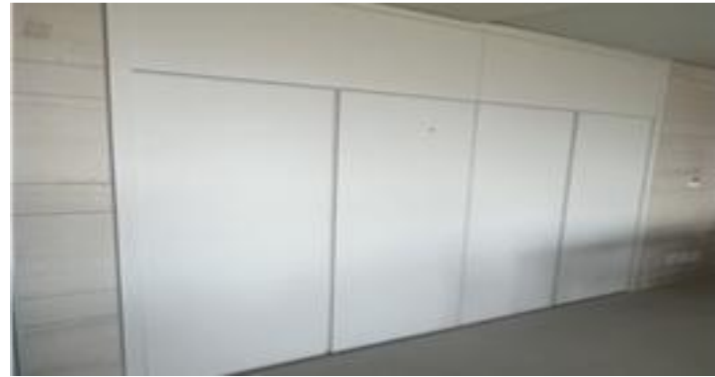
[PDR룸 가구 도어 제작]