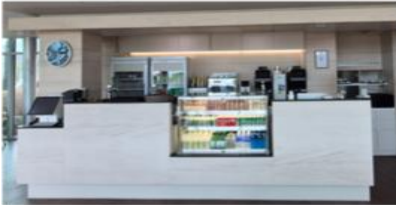
[음료 및 서비스 테이블 교체]